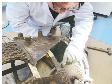
方晨正在焊接曾侯乙编钟的补件和残片。