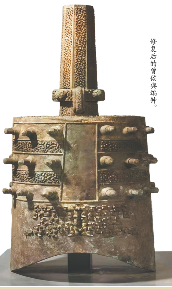
修复后的曾侯乙编钟。