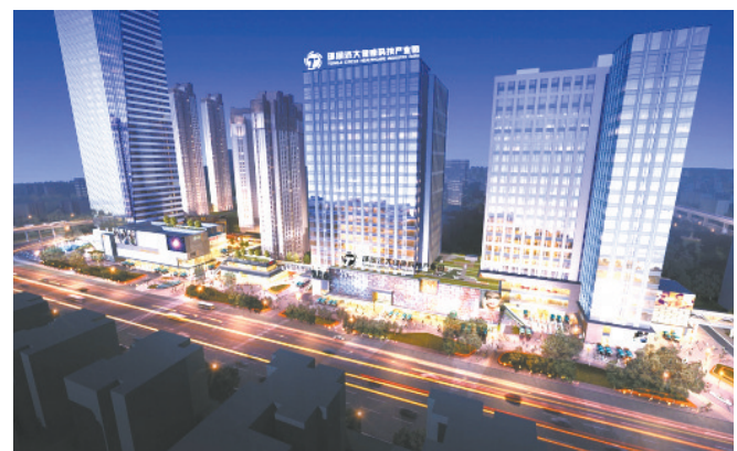
环同济大健康科技产业园效果图。

科技成果转化再提升。搭建创新平台,建设同济产业科创中心,建立医学转化平台10个。年孵化创新项目100个。到2025年,获批并落地销售结算创新药、医疗器械不少于50项,销售收入达到100亿元。空间载体再聚合。整合100万平方米产业孵化载体,建设高端医疗、医技研发、企业总部、健康金融四大功能中心。建设创新孵化平台、科技研发平台。实施楼宇