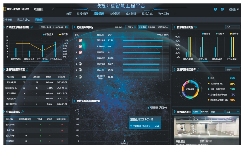
联投U建智慧工程平台开辟“零渗漏”专项，以数字化手段关注渗漏点。

据统计，2023年底，联投置业首次实现客户总满意度、忠诚度两个一级指标超行业均值，其中满意度78.1分，超行业均值7.8分。