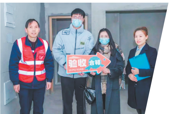
联投濮园业主参加“真品质、敢找茬”活动，实地验收房屋品质。