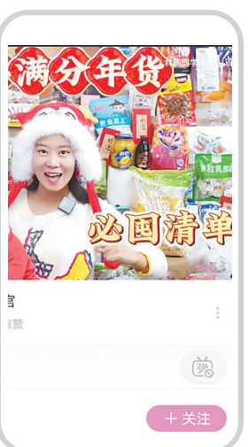
平台年货种草视频手机截图