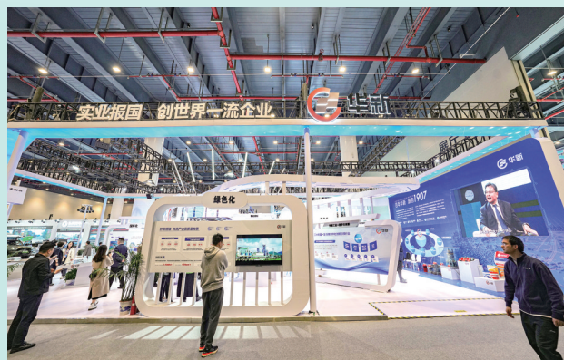
华新精彩亮相2023中国5G+工业互联网大会。