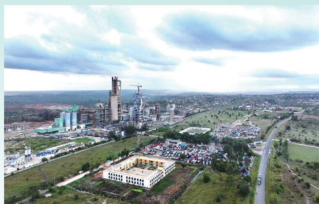
华新坦桑尼亚马文尼公司全景。