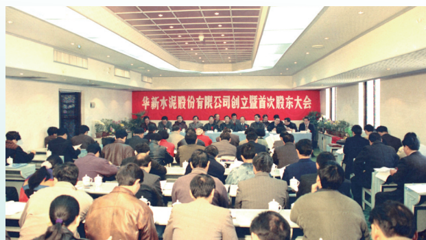
1993年11月28日,华新水泥股份有限公司创立大会在黄石召开。

两年来,虽遭遇前所未有的“寒冬”,但前瞻性战略决策的落地,让华新业绩跑赢大势名列行业前茅。