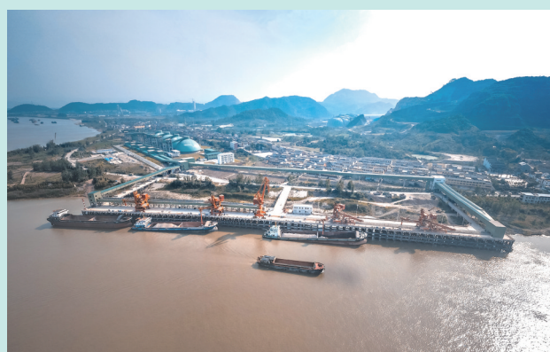
华新阳新亿吨机制砂项目全景。