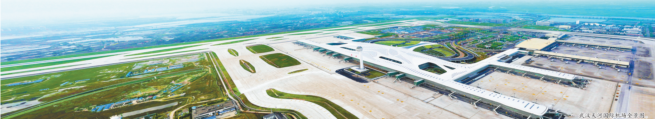
武汉天河国际机场全景图。

2024年1月，全国民航时刻协调会将在武汉召开，湖北机场集团全力筹备，力争在2024年夏秋航季获得更优的航班时刻编排和更足的运力投放，为广大旅客航空出行提供更多选择，为广大商务旅客来鄂投资兴业提供更好保障。