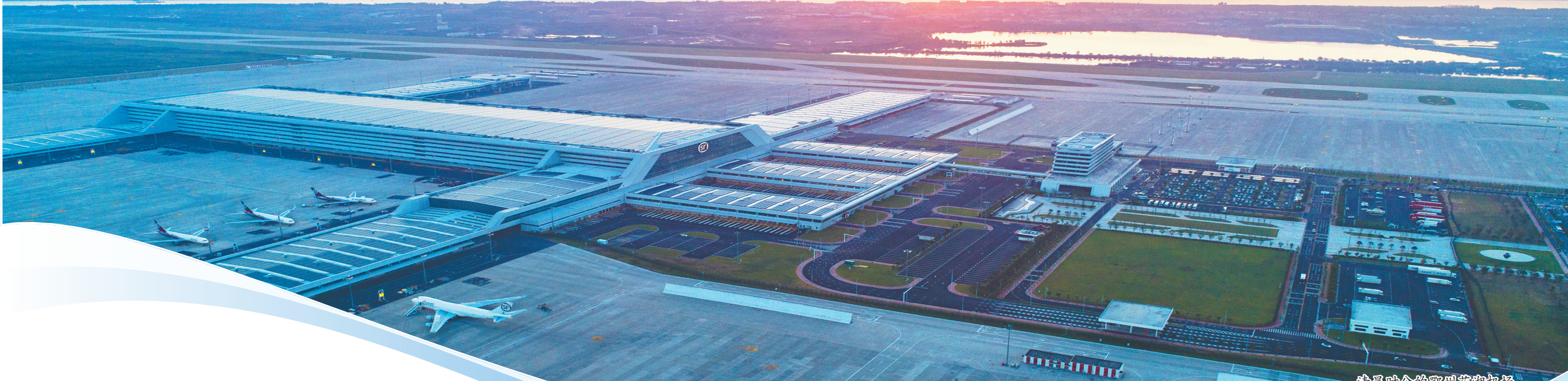
清晨时分的鄂州花湖机场。

自省属国企新一轮深化改革以来，湖北机场集团牢记职责使命，主动求变，聚焦武汉、鄂州航空客货“双枢纽”建设，联动“多支线”协同发展，助力构建“铁水空”多式联运体系，在“九省通衢”向新时代“九州通衢”的跨越中奋力畅通“空中出海口”，在湖北建设国内大循环的重要节点和国内国际双循环的重要枢纽中勇当排头兵。