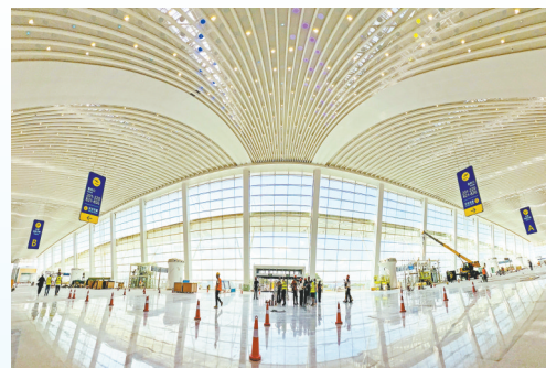
武汉天河国际机场T2航站楼改造工程。

2023年11月2日，武汉天河国际机场T2航站楼改造工程顺利通过行业验收，正抓紧进行店面装修。12月8日，寒冬中的武汉天河国际机场第三跑道施工现场热火朝天，鄂州花湖机场酒店历经80多个昼夜的不间断施工建成启用，海关指定监管场所、空港保税物流中心(B型)、公共国际货站等对外平台装修工程如火如荼。湖北对外开放的航空枢纽平台正在速度与效率的双向奔赴中越展越开。