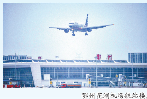
鄂州花湖机场航站楼。