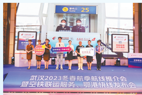
武汉天河国际机场空铁联运服务推介。