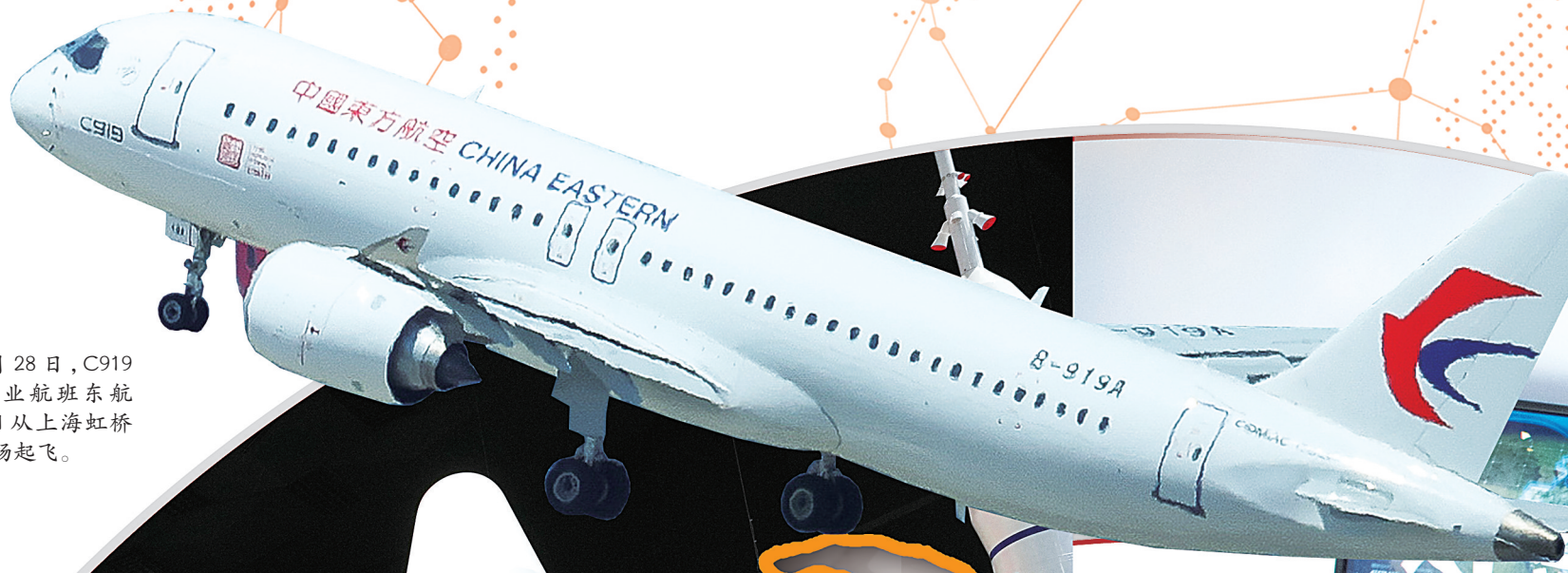
5月28日,C919首个商业航班东航MU9191从上海虹桥国际机场起飞。

治国常新,利民为本。2023年全国两会期间,习近平总书记应邀参加江苏代表团审议时强调,“必须以满足人民日益增长的美好生活需要为出发点和落脚点,把发展成果不遗余力地转化为生活品质,不断增强人民群众的获得感、幸福感、安全感”。这一年,民生改善向新而行——我国在全力稳增长的同时持续擦亮民生底色,扎实推出一项项惠民政