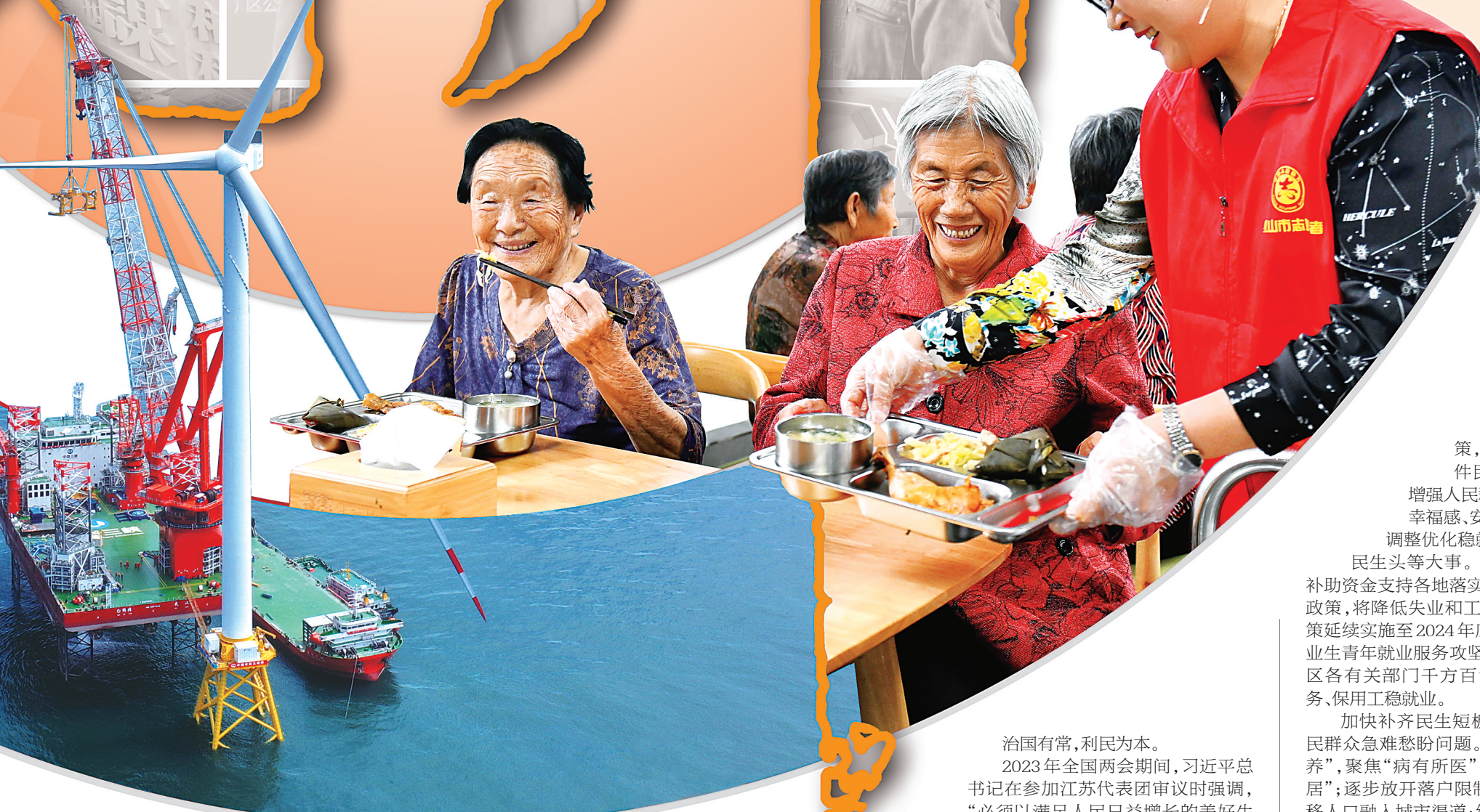
6月28日,在福建北部海域拍摄的全球首台16兆瓦大容量海上风电机组。