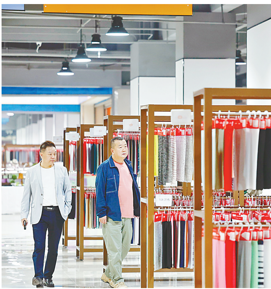
纺织品集散中心“中国轻纺城”在汉口北开设全球纺织面料展示中心“布码头”武汉分馆,国内外200余家源头面料厂商带来数万款最新时尚面料,让全球纺织业高端资源汇聚武汉。

三大服务内容,并不断整合北上广深头部设计师资源以及构建本地原创设计师集群,为企业提供原创款式、样衣交易、面料批发、趋势发布等服装设计研发与品牌建设解决方案,擦亮湖北纺织服装产业新名片。