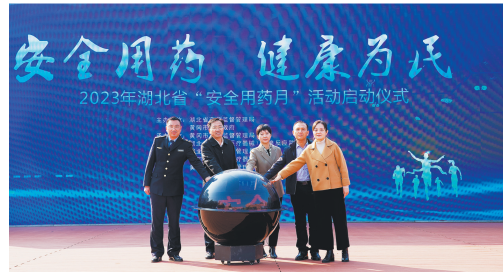
2023年湖北省“安全用药月”活动启动仪式在黄冈市举办。

药月”活动期间,省药监局联合社会各界,以“安全用药 健康为民”为主题,开展了形式多样的宣传活动,持续普及药品安全知识,引导公众树立健康科学安全用药理念,加快促进药品安全社会共享共治格局。