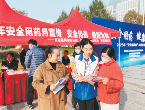
省药监局襄阳分局联合襄阳市襄城市场监管分局在美联广场开展“安全用药 健康为民”科普宣传活动。