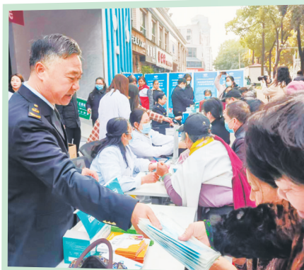
省药监局荆门分局联合荆门市疾控中心健康科普馆共同举办安全用药月科普宣传活动。

在鄂州,宣传人员深入社区开展药品安全宣传,向居民发放药品安全宣传册及环保袋,播放科普视频,营造良好用药氛围。