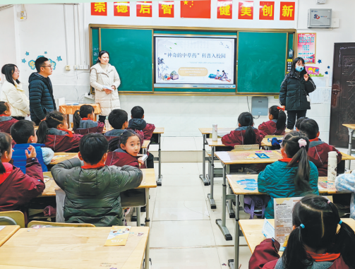
省药监局在武汉市东亭学校小学开展以“安全用药进校园,中药科普展新颜”为主题的安全用药月主题活动。