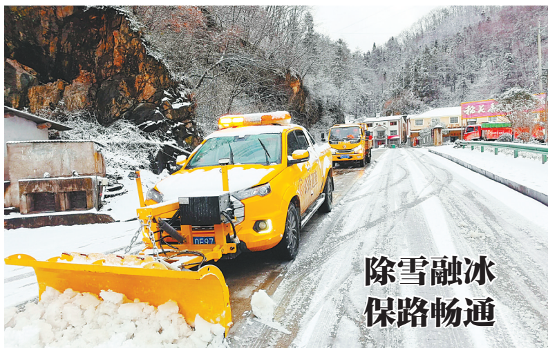
除雪融冰 保路畅通

12月18日,宜昌市夷陵区、秭归县公路建设养护部门持续除雪融冰,确保公路畅通。受冷空气影响,宜昌迎来大幅降温和雨雪天气,海拔800米以上区域公路路面出现不同程度积