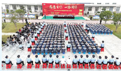
全省监狱开展“统一开放日”活动。

策划第二届全省监狱系统“最美女警”投票评选活动,从全系统3000名女警中,评选“最美女警”30名,宣传巾帼风采。全系统评