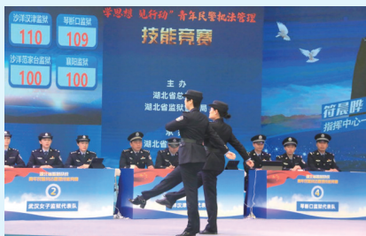
省监狱管理局开展“学思想 见行动”青年民警执法管理技能竞赛。