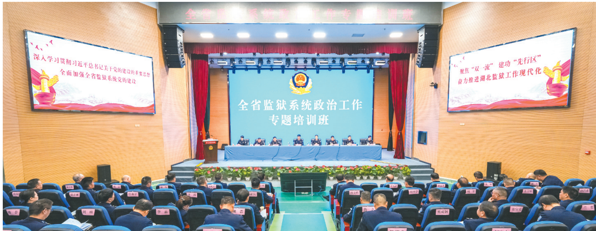
全省监狱系统政治工作专题培训班举办现场。