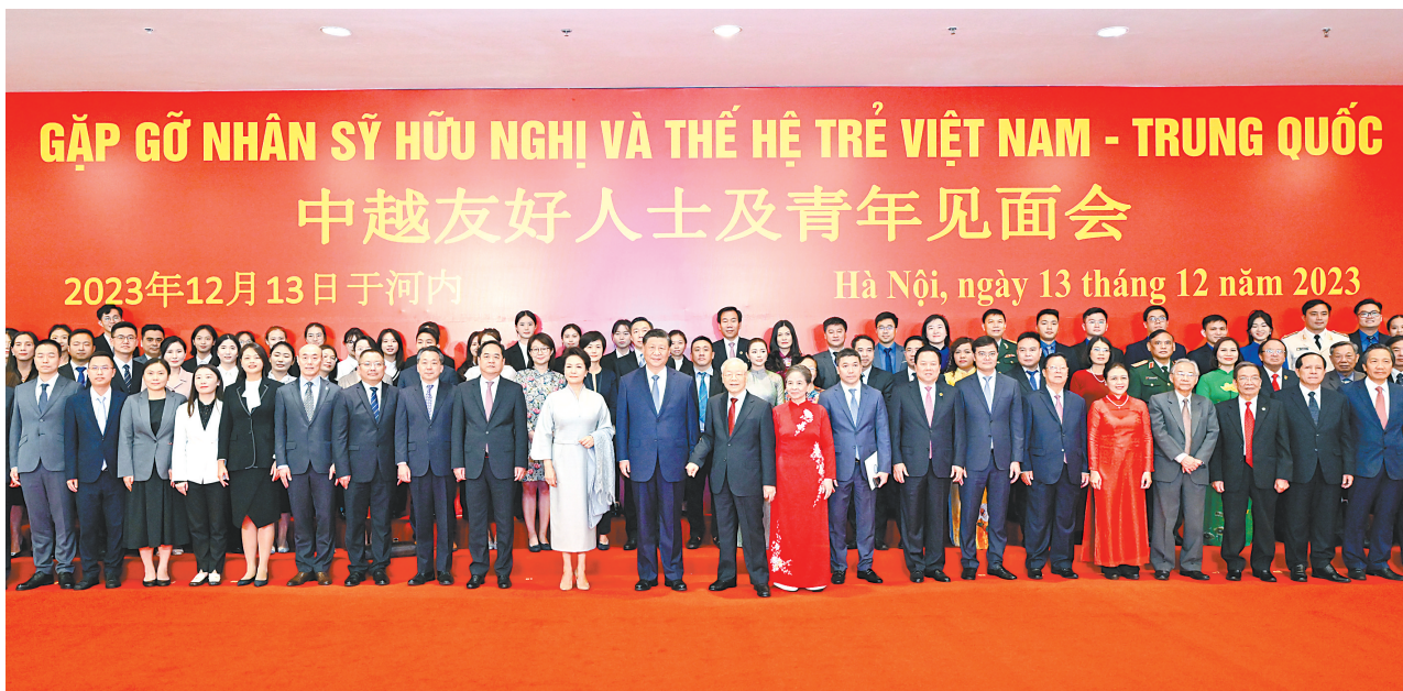
当地时间12月13日下午,中共中央总书记、国家主席习近平和夫人彭丽媛在河内同越共中央总书记阮富仲夫妇共同会见中越两国青年和友好人士代表。这是习近平夫妇和阮富仲夫妇共同会见中越两国青年和友好人士代表亲切合影。

政领导人和地方代表到机场送行。 习近平主席夫人彭丽媛,中共中央政治局常委、中央办公厅主任蔡奇,中共中央政治局委员、外交部部长王毅,中共中央书记处书记,公安部副部长王小洪等陪同人员同机返回。