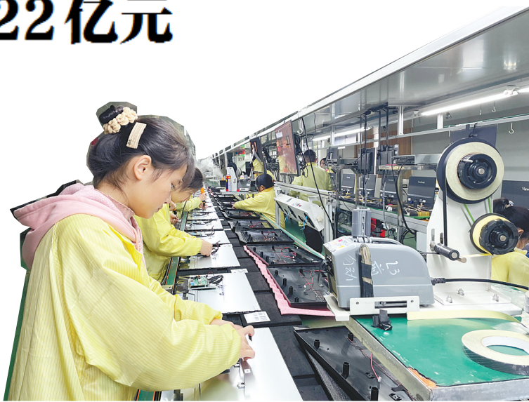
形诺电子鄂州工厂生产线一角。

武汉新城和花湖机场两大省级战略叠加,正是鄂州腾飞的历史窗口期。鄂州市紧密围绕高端装备、生物医药、新能源、新材料等产业展开布局,挑选出成长型企业,加强与企业联动,帮助企业解决经营中遇到的政策问题,助力“专精特新”中小企业发展壮大。