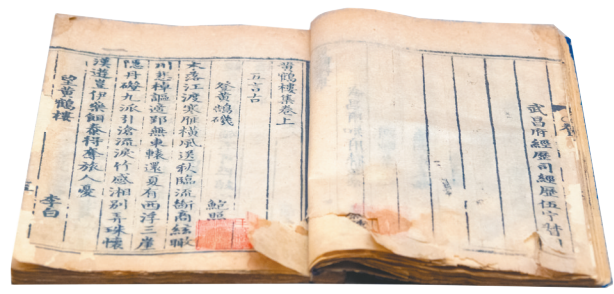
湖北省图书馆收藏的明万历武昌府刻本《黄鹤楼集》。

11月15日，为期一个月的“册府千华——湖北省藏国家珍贵古籍展”在湖北省图书馆开展。“册府千华”系列展览是由国家图书馆、国家古籍保护中心组织策划的全国范围的大型珍贵古籍专题展，2014年9月第一场“册府千华”大展，即在湖北省图书馆新馆亮相，目前这个系列展览已经在全国21个省份举办了30场。