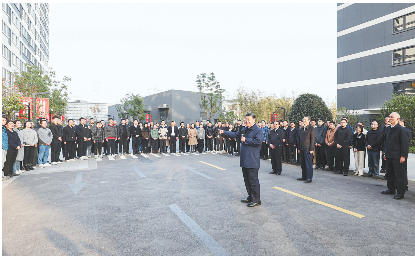
11月28日至12月2日,中共中央总书记、国家主席、中央军委主席习近平在上海考察。这是11月29日下午,习近平在闵行区新时代城市建设者管理者之家,同社区居民亲切交流。

新华社上海/江苏盐城12月3日电 中共中央总书记、国家主席、中央军委主席习近平近日在上海考察时强调,上海要完整、准确、全面贯彻新发展理念,围绕推动高质量发展、构建新发展格局,聚焦建设国际经济中心、金融中心、贸易中心、航运中心、科技创新中心的重要使命,以科技创新为引领,以改革开放为动力,以国家重大战略为牵引,以城市治理现代化为保障,勇于开拓、积极作为,加快建成具有世界影响力的社会主义现代化国际大都市,在推进中国式现代化中充分发挥龙头带动和示范引领作用。