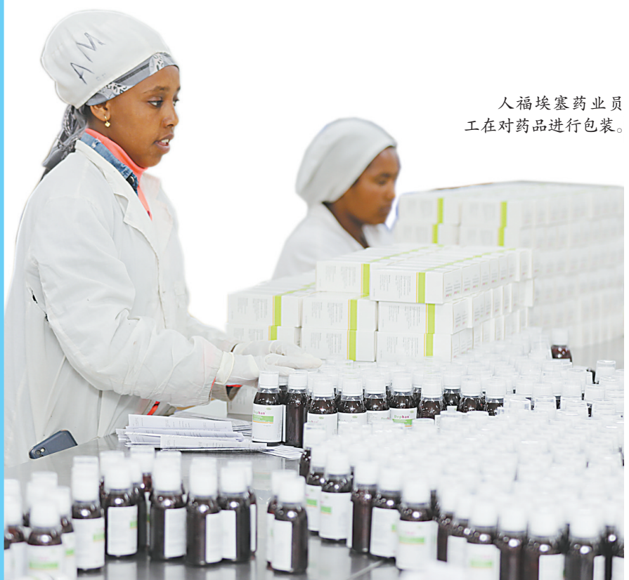
人福埃塞药业员工在对药品进行包装。