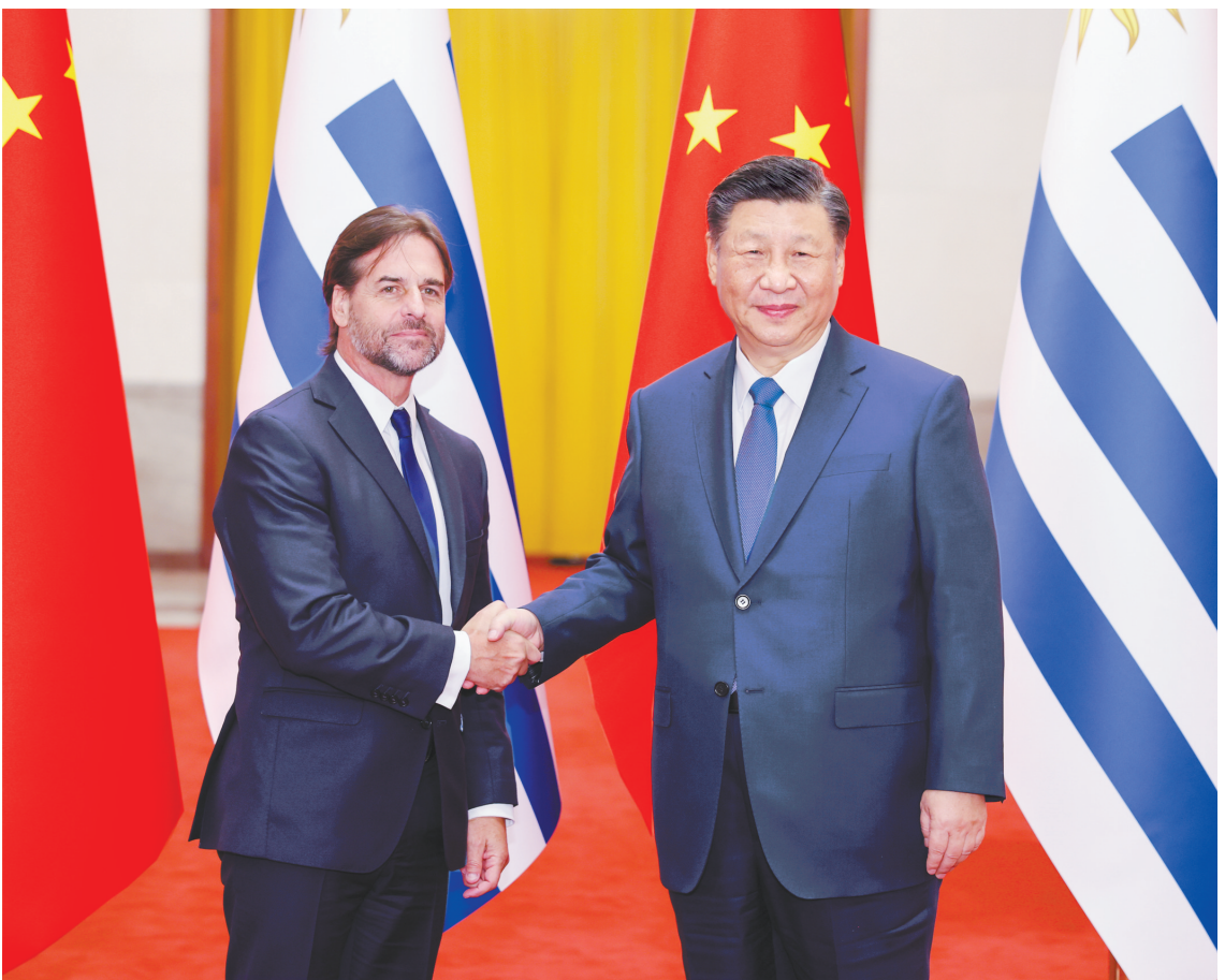
11月22日下午,国家主席习近平在北京人民大会堂同来华进行国事访问的乌拉圭总统拉卡列举行会谈。这是会谈前,习近平在人民大会堂北大厅为拉卡列举行欢迎仪式。

新华社北京11月22日电 11月22日下午,国家主席习近平在人民大会堂同来华进行国事访问的乌拉圭总统拉卡列举行会谈。两国元首宣布,将中乌关系提升为全面战略伙伴关系。 习近平指出,2023年是中乌建交35周年和乌拉圭加入共建“一带一路”倡议5周年。建交35年来,两国始终坚持相互尊重、平等相待、合作共赢,各领域交流合作蓬勃发展。特别是面对新冠疫情,两国守望相助、同心抗疫,中乌战略伙伴关系得到升华。中方愿同乌方一道,以建立全面战略伙伴关系为新起点、新坐标,提升双边关系水平,丰富两国合作内涵,将中乌关系打造成为不同体量、不同制度、不同文化国家团结合作的典范,更好服务各自国家发展,增进两国人民福祉。 习近平介绍了中国式现代化的内涵意义,表示中方愿同乌方加强治国理政交流,增进政治互信,共享发展机遇,推动实现各自国家的现代化和世界现代化。双方要密切立法机构、政党、地方友好交流合作,以签署共建“一带一路”合作规划为契机,加强发展战略对接,培育服务贸易、数字经济、清洁能源等领域合作新动能,推动中乌共建“一带一路”进入高质量发展新阶段。欢迎更多乌拉圭优质农牧产品和高附加值产品进入中国市场,鼓励中国企业赴乌投资兴业,希望乌方继续为中国企业提供良好营商环境。双方要促进文化、体育等人文交流,为两国人员往来创造更多便利条件,中方愿向乌方提供更多奖学金名额。 (下转第6版)