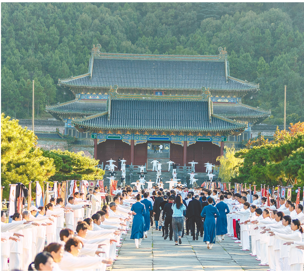
开幕式盛会。

10月23日,2023世界武当太极大会开幕式在十堰市武当山隆重举行。此次大会共有3个板块9项活动,33个国家和地区的2000多名中外友人齐聚武当,现场签约文旅项目20个,投资总额达283.3亿元。