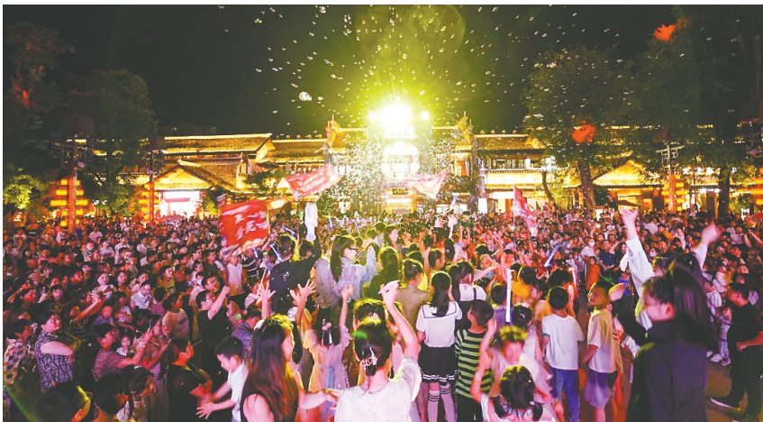
房县西关印象游人如织。

十堰市计划,回归山城固有的亲山、近山、赏山、乐山特色,持续推进健康步道建设,串联中心城区百余座山体,为百万市民构建一个与自然和谐相融的生态步道体系。