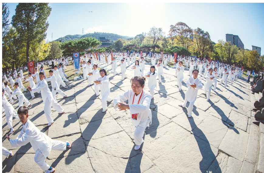
太极拳表演。

一切机会进行交流“切磋”。组委会也特意举办“世界太极观”高端对话活动,邀请海内外著名文化学者、太极名家和养生名家“武当论见”,一起为推进太极文化的国际传播出谋划策。