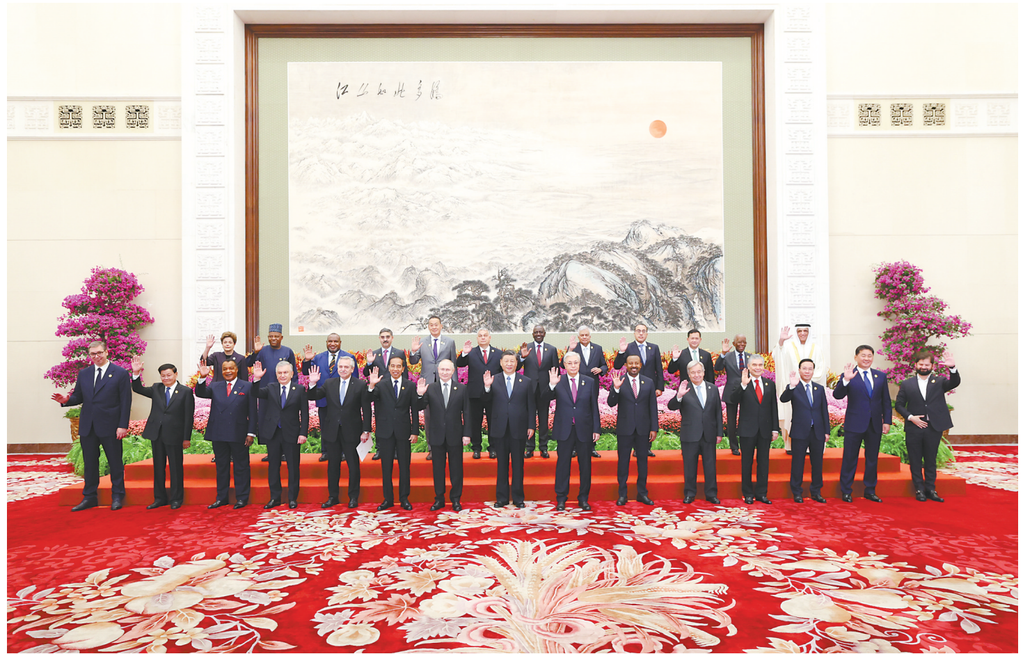
10月18日上午,国家主席习近平在北京人民大会堂出席第三届“一带一路”国际合作高峰论坛开幕式并发表题为《建设开放包容、互联互通、共同发展的世界》的主旨演讲。这是会前,习近平同出席高峰论坛的外国国家元首、政府首脑和国际组织负责人等国际贵宾集体合影。

新华社北京10月18日电 10月18日上午,国家主席习近平在人民大会堂出席第三届“一带一路”国际合作高峰论坛开幕式并发表题为《建设开放包容、互联互通、共同发展的世界》的主旨演讲。习近平宣布中国支持高质量共建“一带一路”的八项行动,强调中方愿同各方深化“一带一路”合作伙伴关系,推动共建“一带一路”进入高质量发展的新阶段,为实现世界各国的现代化作出不懈努力。