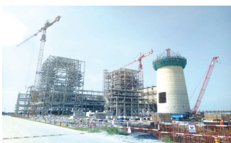
印尼棉兰工业园燃煤发电厂工程。