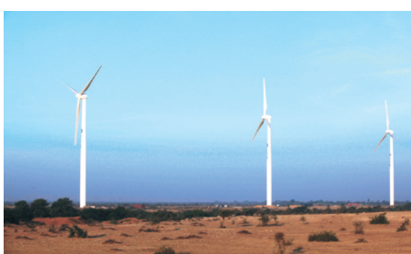
巴基斯坦吉姆普尔联合能源风电二期工程。