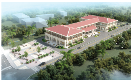
中国援老挝人民革命青年团中央活动中心项目效果图。