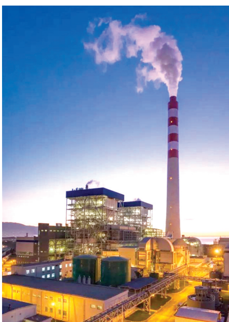
土耳其阿特拉斯2×600MW伊斯肯德伦火电厂工程(国家优质工程金奖)。