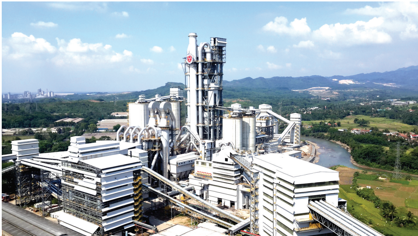
印尼雅加达P14中材水泥厂10000T/D水泥生产线工程。