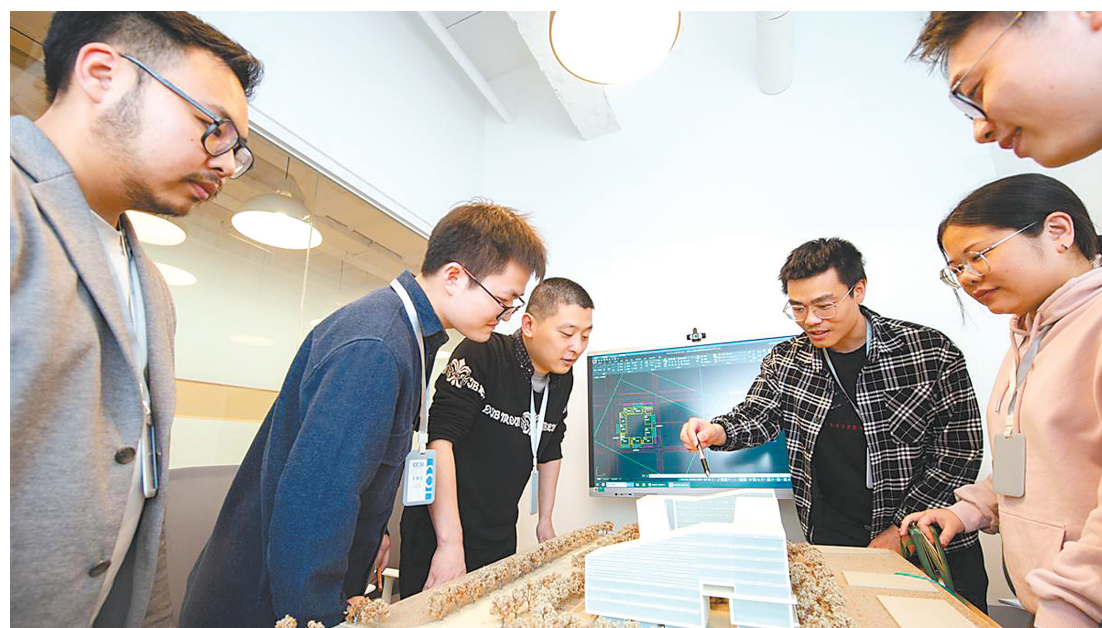
自今年落户江岸后,CCDI悉地国际武汉分公司项目签约量同比大幅增长。

“力争到2025年,高新技术产业产值突破1000亿元。”面向未来,江岸区相关负责人充满信心。