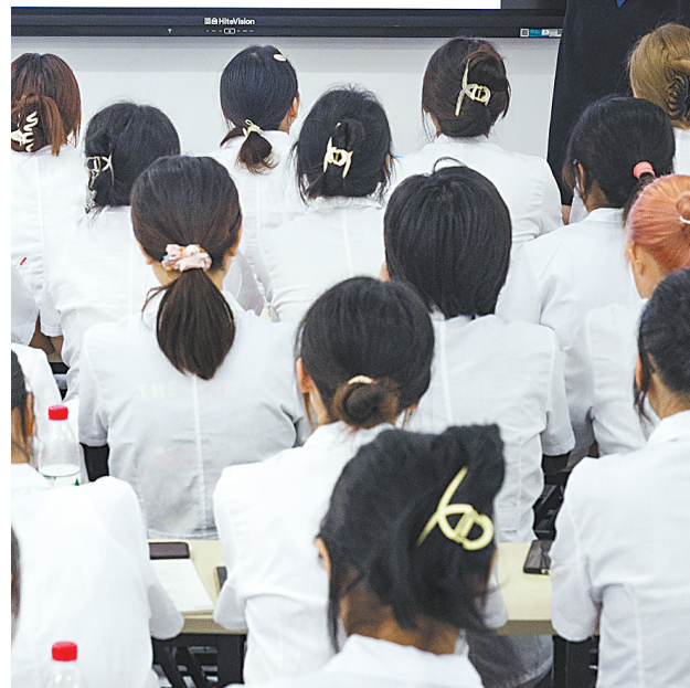
武汉民政职业学院老师为学生们讲授养老护理专业知识。