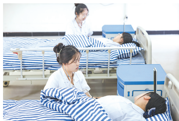
9月8日,在武汉民政职业学院老年护理实训室内,该校智慧健康养老服务与管理专业的学生在实操中学习养老护理知识。