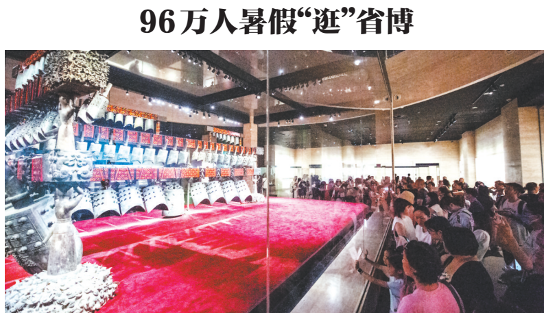
9月10日,湖北省博物馆参观游客络绎不绝,不少热门展厅人气爆棚。在刚刚过去的暑假,该馆共接待观众96万余人,旅行社4931批,越来越多的市民、游客选择在这里看文物、学历史,充实假日生活。

质的生产单位,确保食盐储备有来源、有质量,牢牢筑起保供稳价“安全堤”。 “盐”而有信: 48小时内调运食盐2.17万吨 “缺货……” 8月24日以来,在部分电商平台与大小超市等终端市场,食盐需求激增。湖北盐业集团旗下各分、子公司迅速启动24小时应急保供机制,依托全省103个县市区设立的83个分公司(批发部),发动千余名党员职工加班加点下单、补货、配送,出动车辆1600余台次,将“云鹤”食盐配送至全省各地商超、农贸市场、社区门店等终端零售网点和电商平台。 (下转第2版)