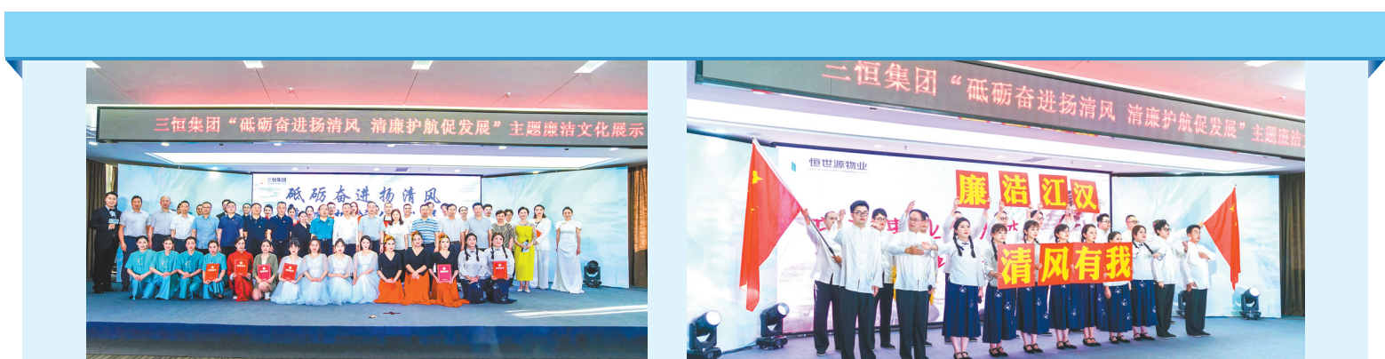
三恒集团开展廉洁文化展示活动。

三恒集团职工热情参与本次廉洁主题文化展示活动,在工作之余,节目自己编、歌词自己创、演员自己当、导演自己上,掀起自我教育清正作风、全员宣传廉洁文化的浪潮,以歌舞戏剧多元形态弘扬廉洁正气。